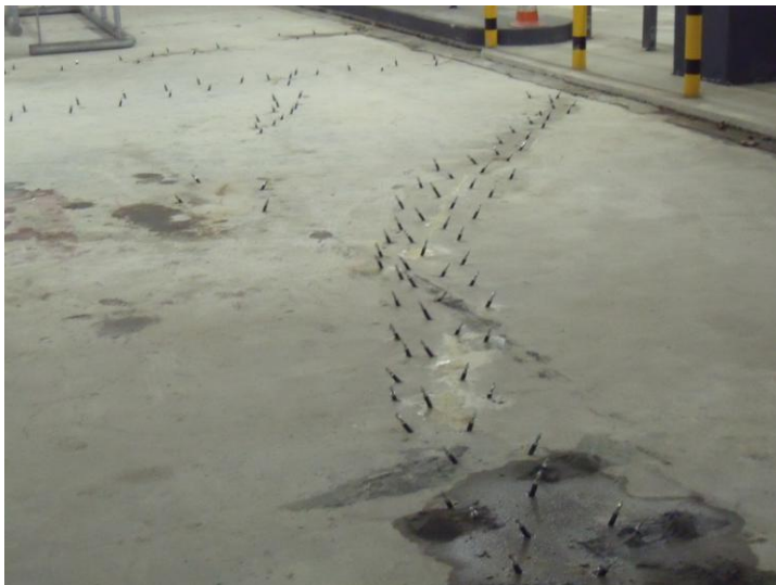
Abb. 3: typische Anordnung der Packer

Mit dem abP ist häufig auch die Verfahrensweise der Applikation festgelegt. Die Hersteller liefern neben den Produkten auch die Anwendungstechnik mit.