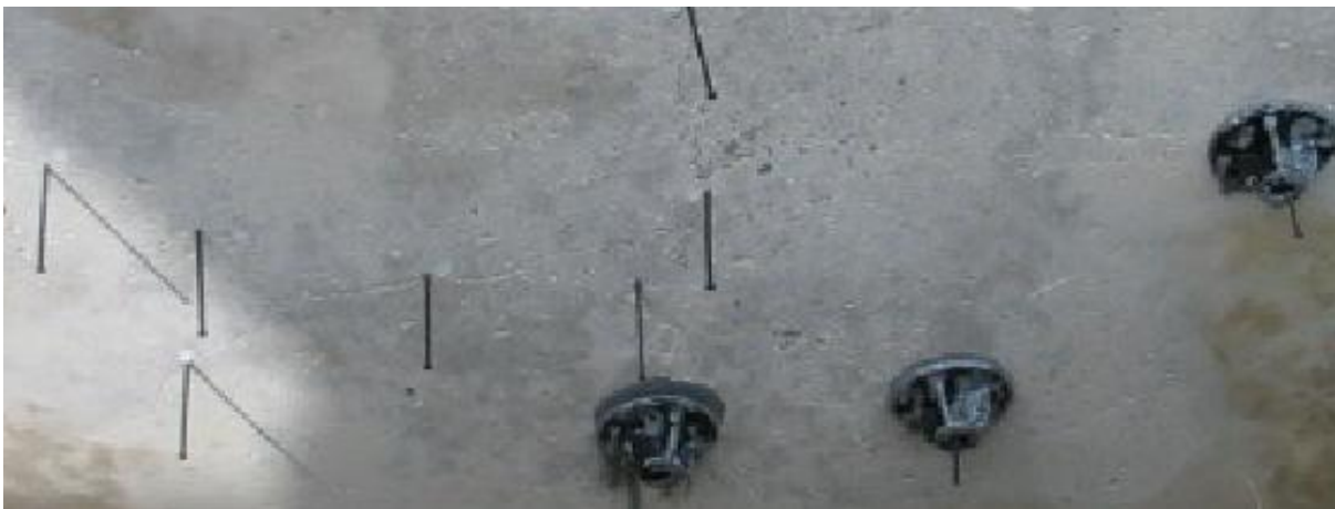
Abb. 4: Arretierungsstifte im Rissverlauf und aufgesetzte Klebepacker

Die Niederdruckinjektion löst dieses Problem und ist für geringere Baustoff-festigkeiten geeignet. Die ausreichende Rissfüllung wird mit weniger handwerklichem Aufwand ermöglicht. Eine häufig anzutreffende Applikation erfolgt über die in Abb.4 gezeigten sog. Klebepacker. Entgegen der alternierenden Positionierung der tiefgreifenden Packer (vgl. Abb.3), wird hier direkt in den Rissverlauf injiziert. Die Arretierungsstifte verhindern einen Verschluss des Risses durch das Klebematerial der Packerbefestigung und werden nach dem Aufkleben der Packer entfernt und die Ventilnippel eingeschraubt. Der Füllvorgang verläuft ist analog zu 4.1.1 .