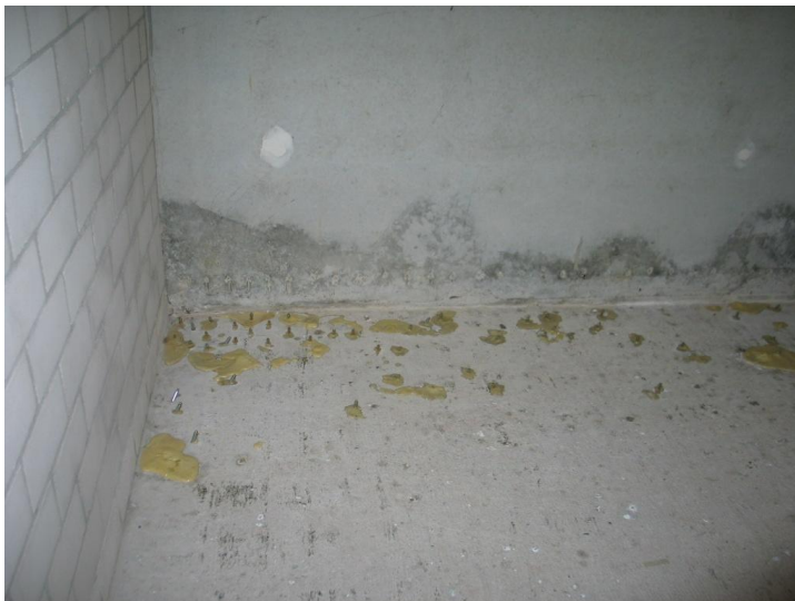
Abb. 1: Undichtigkeiten am Wandfuß

Während Risse manchmal noch als unerklärlich gelten können, müssen Gefügestörungen als grobe handwerkliche Mängel eingeschätzt werden. Sie entstehen beim Betoniervorgang und führen als sog. Nester zu gravierenden Undichtigkeiten. Der Erfolg jeder Betonieraufgabe ist auf die Abstimmung des Materials und die Ausführung angewiesen. Das Größtkorn muss zum Bewehrungsabstand passen und Betonieröffnungen in der Bewehrung sind planerisch vorzusehen. Die Betonverdichtung ist zwingend und erfordert immer eine Nachverdichtung, um Wasseransammlungen unter groben Gesteinskörnern und der Bewehrung auszutreiben. Nach subjektiver Einschätzung des Verfassers sind 90% aller Elementwände innen viel zu glatt und ein Vornässen der Innenseiten findet in nahezu 100% der Fälle gar nicht statt. In der Folge sind WU-Konstruktionen aus Elementwänden besonders anfällig für Umläufigkeiten und Kiesnester am Wandfuß, die auch durch Fugenbleche nicht mehr geschlossen werden können (vgl. Abb.1).