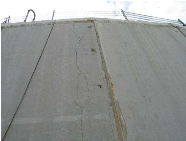
Abb.2: zerstörte Elementwand

welche beim Aufstellen der Elementwände manuell “zerstört” wurde. Das besondere Problem der Instandsetzung von WU-Konstruktionen: Im Gegensatz zu monolithischen WU-Wänden gibt es keinen direkten Zugriff der Instandsetzung auf die Wege des eindringenden Wassers. Diese Schwierigkeit gleicht der Problematik schwarzer Wannen, bei denen Wassereintritt und Wasseraustritt unauffindbar weit auseinanderliegen können.